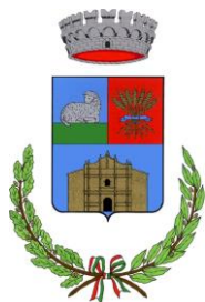
Comune di Mara