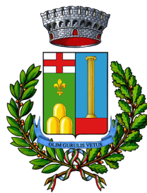
Comune di Padria