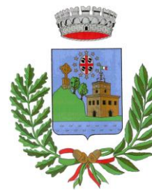
Comune di Villanova Monteleone