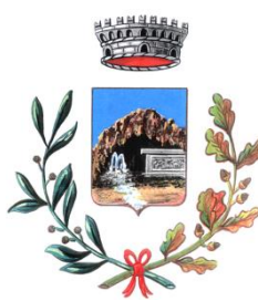
Comune di Romana