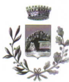
Comune di Romana