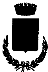
Comune di Mara