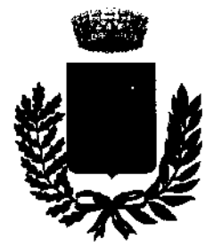
Comune di Villanova Monteleone