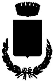
Comune di Mara