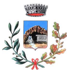
Comune di Romana