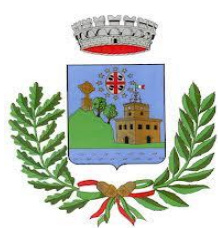
Comune di Villanova Monteleone