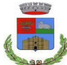
Comune di Mara