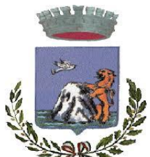
Comune di Monteleone Rocca Doria