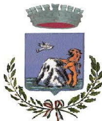
Comune di Monteleone Rocca Doria