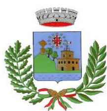
Comune di Villanova Monteleone