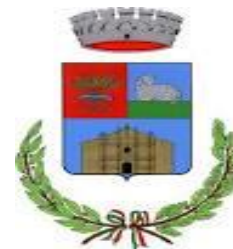
Comune di Mara

DOCUMENTO UNICO DI PROGRAMMAZIONE SEMPLIFICATO (Approvato con deliberazione dell'Assemblea dell'Unione n. 7 del 09.04.2021)