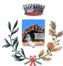
Comune di Romana