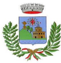
Comune di Villanova Monteleone