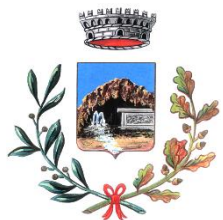
Comune di Romana